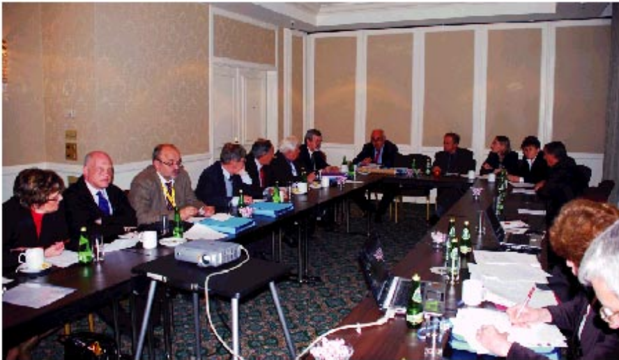
Rycina 3 Posiedzenie ZG PTN, hotel Marriott, Warszawa, 4.06.2009. Meeting of General Council of the Polish Society of Nephrology, hotel Marriott, Warsaw, 4.06.2009.