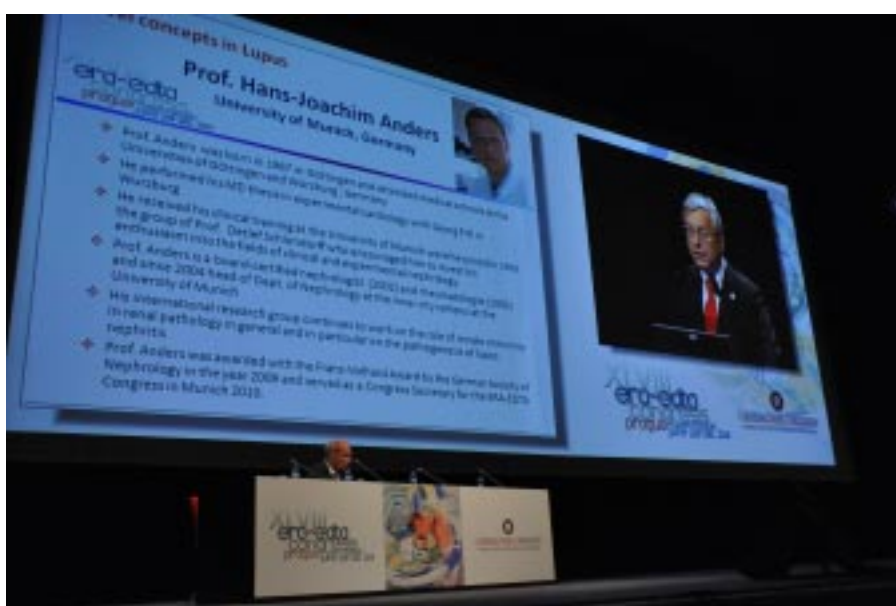
Rycina 7 Profesor Andrzej Więcek podczas 2 wykładu plenarnego. Profesor Andrzej Więcek during the 2nd plenary lecture.