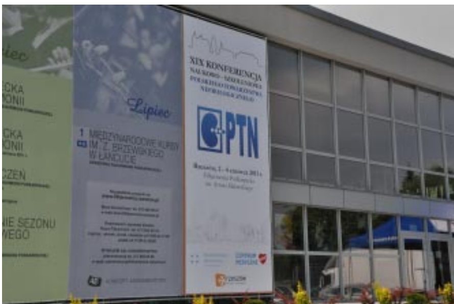
Rycina 1 Filharmonia Podkarpacka w Rzeszowie, miejsce obrad XIX Konferencji PTN.(fot. Maria Ostrowska). The Rzeszów Concert hall, the venue of the XIXth Conference of the Polish Society of Nephrology.