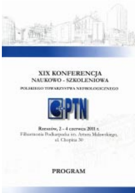
Rycina 2 Strona tytułowa programu XIX Konferencji Polskiego Towarzystwa Nefrologicznego. Title page of the Programme of the XIXth Conference of Polish Society of Nephrology.